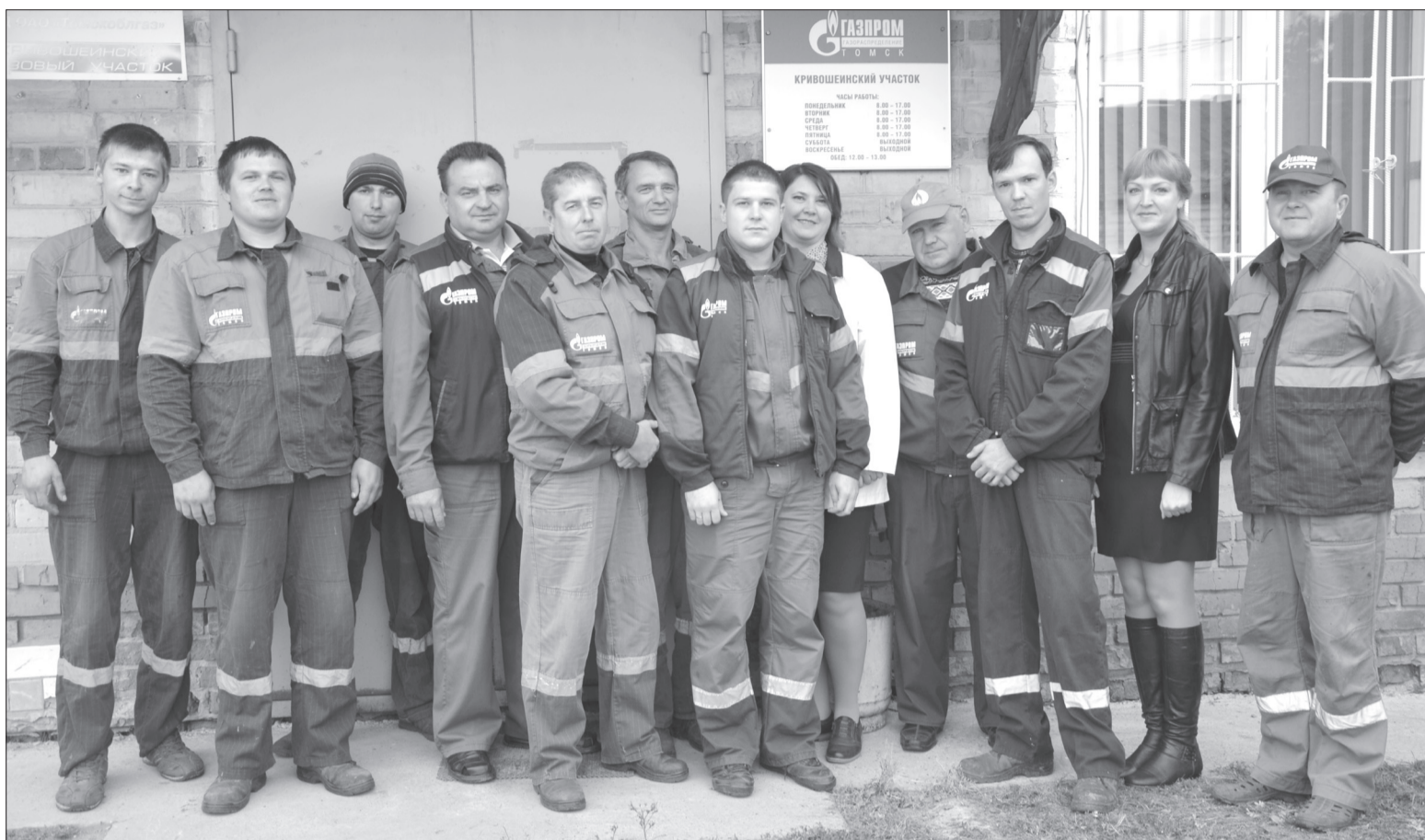
кривошеинский коллектив ООО «Газпром газораспределение Томск»